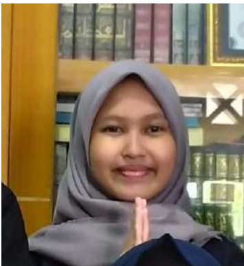
مفازة أكملى النادية لله

رقم ٢٠ جومبانج جاوا الشرقية)، هذه هي بطاقتها الشخصية.